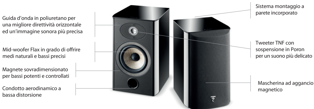
Aria 905 Black High Gloss

Nonostante le sue ridotte dimensioni, il diffusore Aria 905 è capace di riprodurre musica come se fosse uno molto più grande con un suono naturale e senza artifici. Il diffusore ha medi dettagliati così come bassi controllati ed articolati grazie al motore sovradimensionato del driver dei medio-bassi. E' un vero diffusore hi-fi ultracompatto. Il raccordo reflex anteriore ed il sistema di montaggio permettono una facile collocazione a parete senza alcun tipo di problema. E' raccomandato per ambienti a partire da 10mq e per una distanza di ascolto di 2 mt.