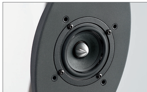
Clou całej konstrukcji – przetwornik średnio-wysokotonowy przenoszący zakres od około 200 Hz do końca pasma akustycznego, gdzie staje się bardzo kierunkowy

kiej faldzie z gumy, a zamiast typowej nakładki przeciwyplotowej, zastosowano aluminiowy korektor fazowy o profilu pociśku. Korektor ma za zadanie m.in. walkę z kierunkowością głośnika, którego średnica jest aż 3-krotnie większa niż w przypadku typowej kopułki. Ma to oczywiście daleko idące konsekwencje dla kierunkowości sopranów. Układ magnetyczny jest neodymowy, a kosz – mimo skromnych wymiarów – odlewany. Zadbano o otwory pod dolnym resorem, tak by cewka miała wydajną wentylację. Sposób wykonania głośnika świadczy o staranności producenta.