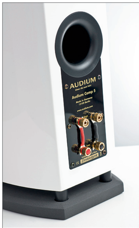
Plastikowe tuleje zapewniają odpowiedni prześwit pomiędzy dolną ścianką a cokołem. Płytki terminali jest wykonana z dość cienkiego tworzywa