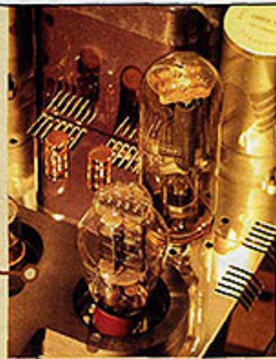
▲ Reference One 身上集齊發燒的兩大天王，前者是「夢幻之球」300B，後者就是大力士 845。

845 膽輸出強勁，但若果沒有一支高質素的推動膽輔助，845 膽很可能變成軟皮蛇，推動大食喇叭時舉步為艱。因此廠方特別使用了被日本人稱為「夢幻之球」、被中港發燒友奉為聖物的 300B 膽擔當這個任務，用作放大膽時，300B 細小的 8W 輸出只可應付效率較高的喇叭，但轉換到推動膽位置，300B 就搖身變成一位大力士，除了將 845 膽服侍周到之外，亦將本身最迷人的甜美聲音融入 845 膽的天生神力之中，混合而成一種動態強橫、甜美自然的風格，這種剛柔並濟的表現過去甚少在一部輸出達 75W 的大力膽機中找到，現在終於被 Reference One 做到了，故此儘管它的身價超過 12 萬，但來自中、港、日、歐、美的訂單仍絡繹不絕，為港人在國際音響界中爭光。@