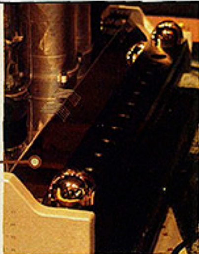
▲黑色鋁條是 Reference One 消暑解熱的法寶。

▲這部 Reference One 後級是《科寶》噶心瀝血之作，無論是外形或內涵都相當傑出，即使《無間道》熱潮已過，也無損此機魅力。